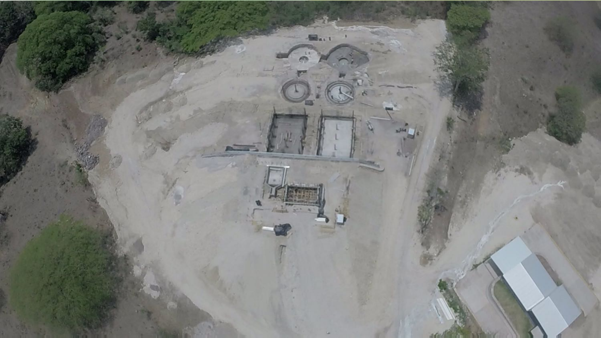
FOTO AEREA SITUACIÓN ACTUAL